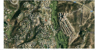
A 2 km se encuentran 3 Centros Comerciales con la entrada de Elviria con todo tipo de servicios (supermercados, gran variedad de restaurantes, servicios médicos, farmacia, etc.). A 3 km se encuentra una de las mejores playas de Marbella (la del Hotel Don Carlos). Además, se puede encontrar también en el entorno Colegios (nacionales e internacionales), Campos de Golf, Gimnasios, Campo de Fútbol, etc.