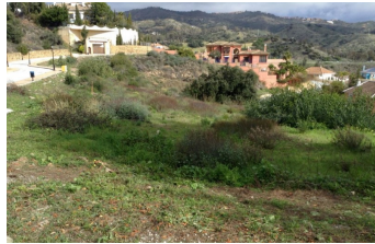
1. Localización – Urbanización Coto de los Dolores